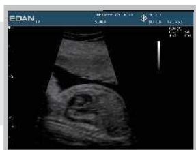
Srdce plodu ve 26 týdnu