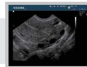
Endovaginální snímek Děloha a vaječníky