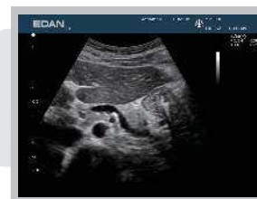
Vynikající kontrast a rozlišení Játra, Slinivka břišní