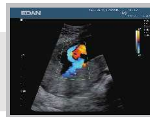
Barevný doppler Druhý trimestr těhotenství