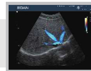
Prostorové rozlišení barev Jaterní žíly