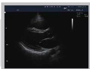
Parasternální dlouhá osa